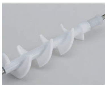
Agitatore / Agitator

L'utilizzo di un agitatore in POM permette la pulizia totale del cilindro, a garanzia di un sistema di refrigerazione efficiente e completo.