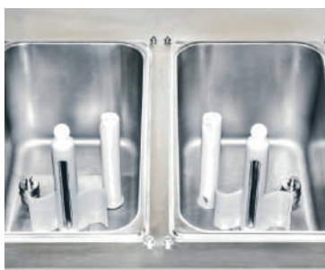
Sistema a gravità / Gravity system

Questa macchina è stata progettata e studiata per poter funzionare come un vero e proprio mantecatore, sfruttando l'inclusione dell'aria tramite forza di gravità per un risultato immediato ed eccellente.